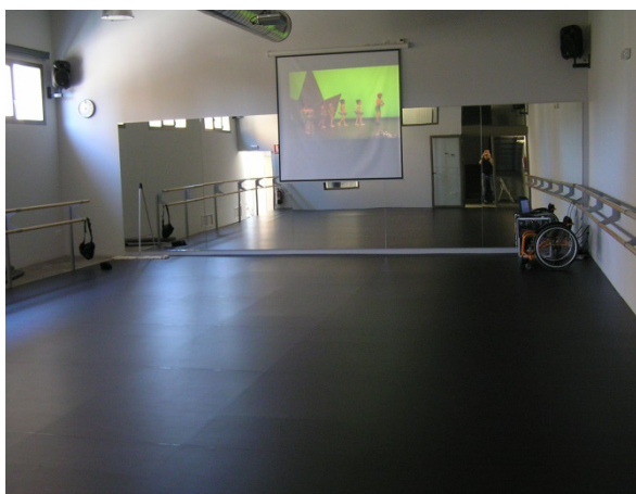
Centre Ensenyaments Artístics i Esportius.

EDS vol ser una organització que sàpiga adaptar-se als canvis de forma tolerant i transigent. Vol que tots els seus integrants actuïn amb respecte i sinceritat, tant entre ells com en el seu entorn. Vol que les persones que la formen estiguin motivades, sentin il·lusió per el seu treball i caminin juntes fins la consecució d'objectius comuns. Vol ser honesta i flexible, i vol aportar valors als seus clients. En definitiva, l'Escola de Dansa SOLSONA s'esforça per ser una empresa en la que la societat confii.